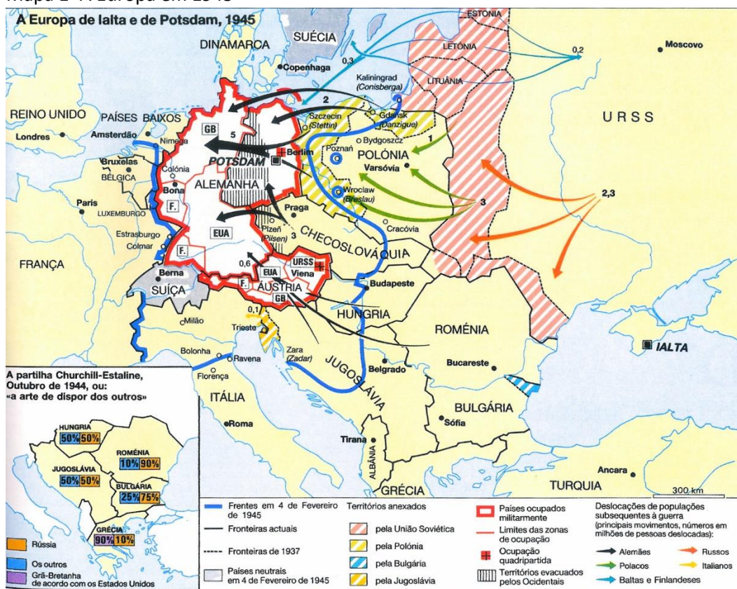
Mapa 1- A Europa em 1945

Vidal-Naquet, P. (dir.) (2008). Atlas Histórico . Lisboa: Círculo de Leitores, p. 291.